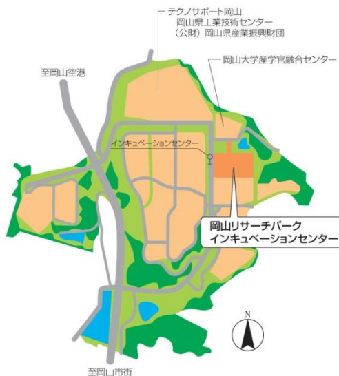
<岡山リサーチパーク内地図>

公共交通機関をご利用の方へ ・岡山駅より中鉄バスで約35分です。 佐山団地経リサーチパーク行乗車 「インキュベーションセンター」下車