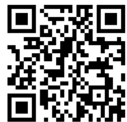
【エヌ・エス・パイ HP】

脱炭素社会の実現に向け、再生可能エネルギーに対する期待が日増しに高まりつつある。自然環境に左右されやすい再生可能エネルギーであるが、安定して発電が行える電源がバイオマス発電である。日本国内におけるバイオマス発電事業は2012年にスタートした再生可能エネルギーの固定買取制度により市場規模が急速に拡大してきており、2016年度対比で2020年度に倍増、2030年度には3倍以上となることが予想されている。市場を牽引するのは木質系バイオマス発電事業とみられているが、一方でメタン発酵ガス化発電事業も増加している。その主体は地方自治体、家畜農家、食品メーカー、産廃処理施設業者等幅広く、下水汚泥、家畜の糞尿や生ごみなどを発酵させることで、メタンなどのバイオガスを発生させて、ガスエンジンで発電を行う。株エヌ・エス・パイは高効率のバイオマスメタンガス発電プラントの設計・施工及び運用に取り組んでいる。